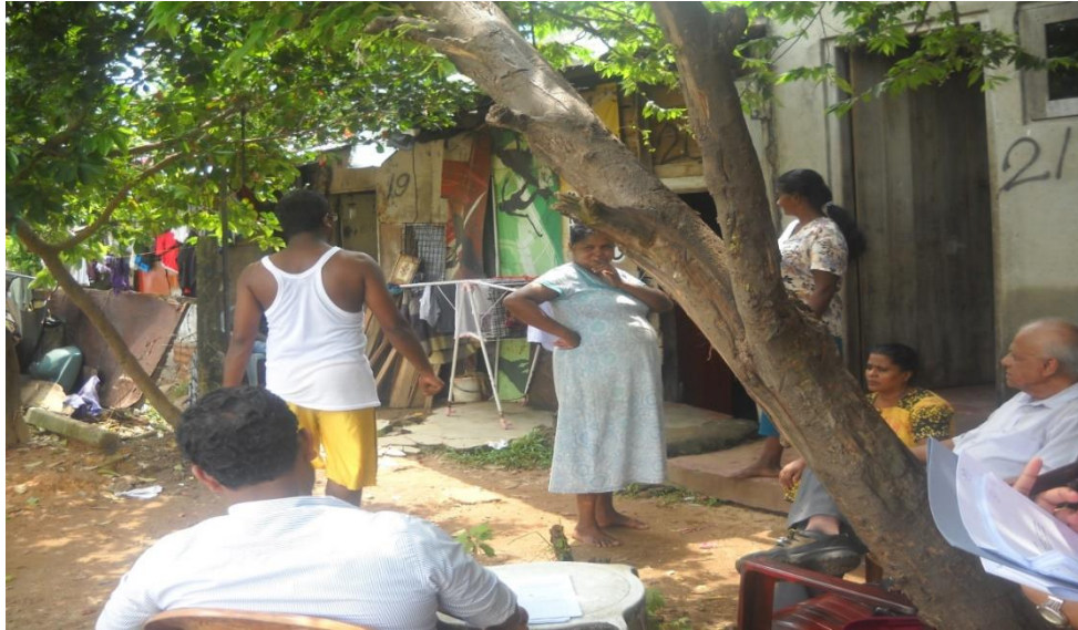
රූප සටහන 3: 2018 10.11 දින ඔබ්බේකරපුර පැවැත්වූ පාශ්චාතීය ජනතාවගේ රැස්වීම