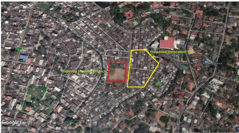
රූප සටහන 1: ඔබේසේකරපුර, අරුණෝදය මාවත සිතියම සහ ගෙනයාමට යෝජිත ස්ථානය

සංගණන සමීක්ෂණය අනුව වැඩි වශයෙන් සිංහල පවුල් ගණනකින් සමන්විත් වෙයි. ගෘහ මූලිකයින් 38 න් 21 ක්ම ඔබේසේකරපුර ප්‍රදේශයට පිටස්තරව උපත ලබා රටේ වෙනත් ප්‍රදේශවලින් එහි පදිංචියට ආ අය වෙති.